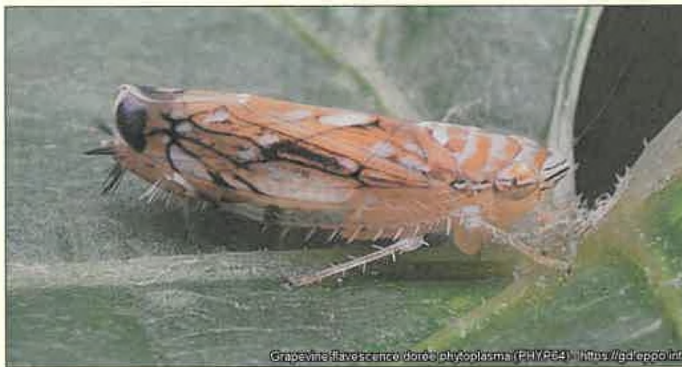
Vektor zlatého žltnutia - cikáda Scaphoideus titanus