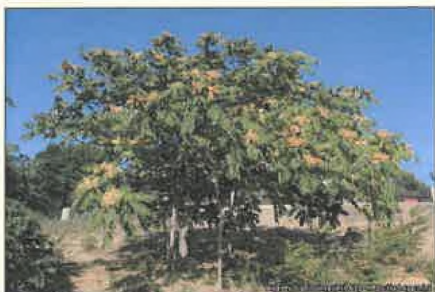
Hostiteľská rastlina pajaseň žliazkatý ( Ailanthus altissima )