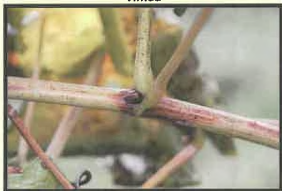
Príznak napadnutia na viniči (čierne pľuzgierky)