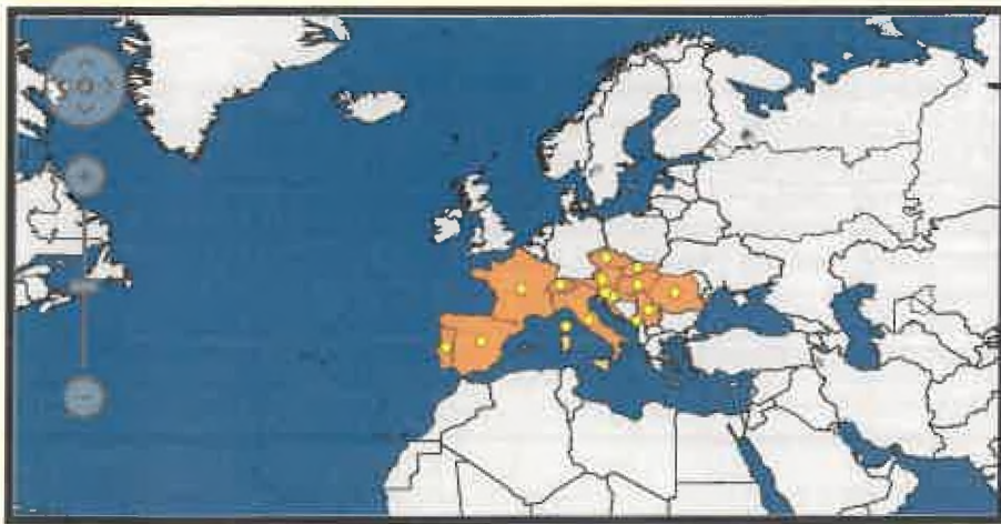
Zlaté žltnutie viniča – mapa rozšírenia podľa EPPO databázy