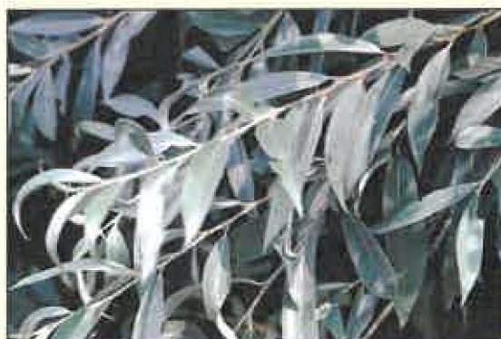
Hostiteľská rastlina vřba ( Salix sp.)