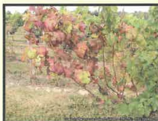
Príznak napadnutia na viniči (sčervenie listov)