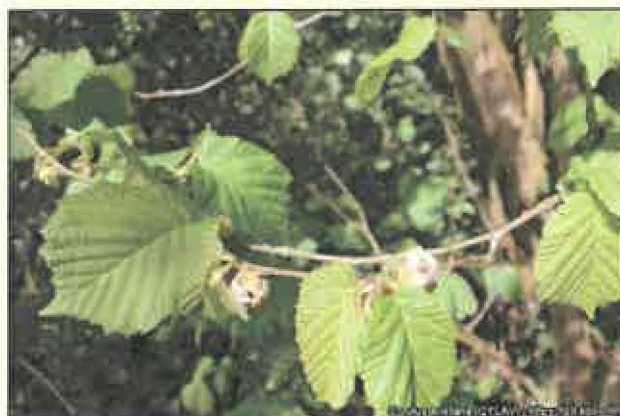
Hostiteľská rastlina lieska obyčajná ( Corylus avellana )