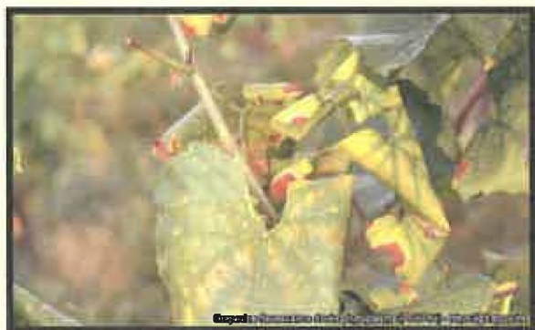
Detailnejší pohľad na žltnutie a stočenie listu viniča

Lokalizovať zlaté žltnutie viniča možno v cievných zväzkoch napadnutého viniča odkiaľ je prijímané vektormi pre ďalší prenos. Jediný infikovaný exemplár môže stačiť na prenos ochorenia a na začiatok nákazy. Fytoplazma bola nájdená v slinných žľazách infikovaného hmyzu (vektora) a sérologicky detegovaná v jednotlivých exemplároch.