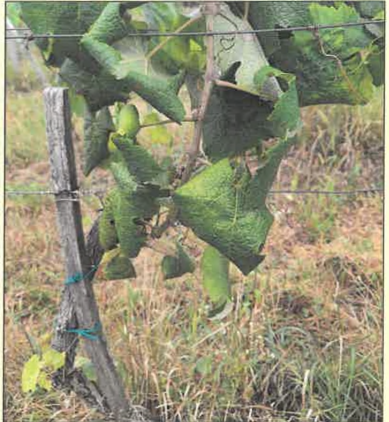
Žltnutie a typické stáčanie listov smerom nadol pri bielych odrodách viniča