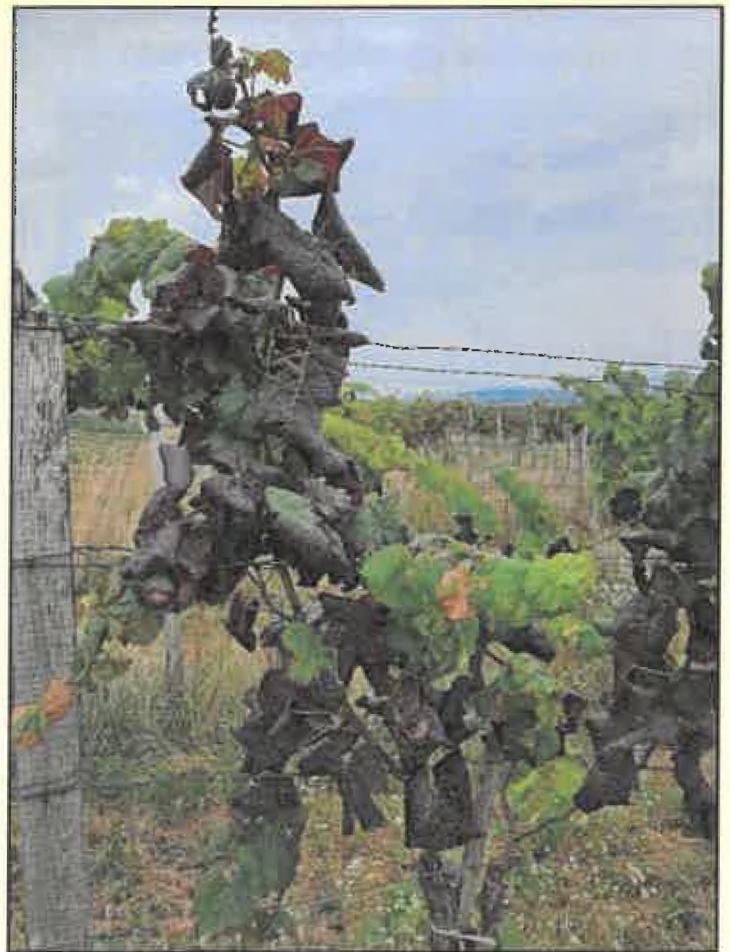
Na modrých odrodách viniča sčervenanie a stáčanie listov nadol