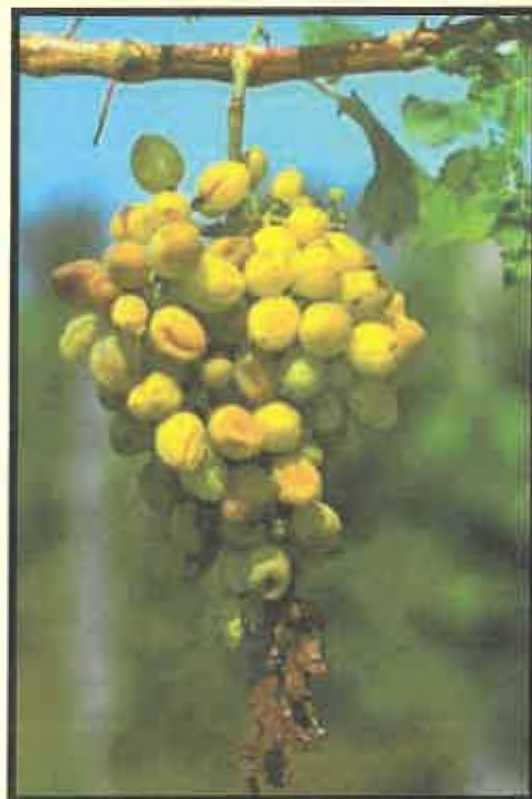
Príznaky pokročilej infekcie strapca hrozna so scvrknutými, miestami hnedými bobuľami