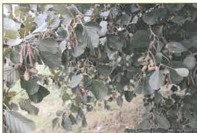
Hostiteľská rastlina jelša lepkavá ( Alnus glutinosa )