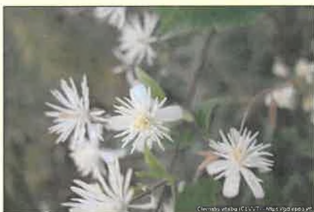
Hostiteľská rastlina plamienok plotný ( Clematis vitalba )