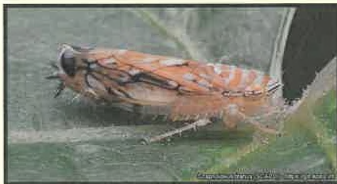
Scaphoideus titanus (cikádka viničová)